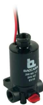
G75-A | 3 Vías | Plástico