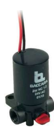
G75-A | 2 Vías | Plástico