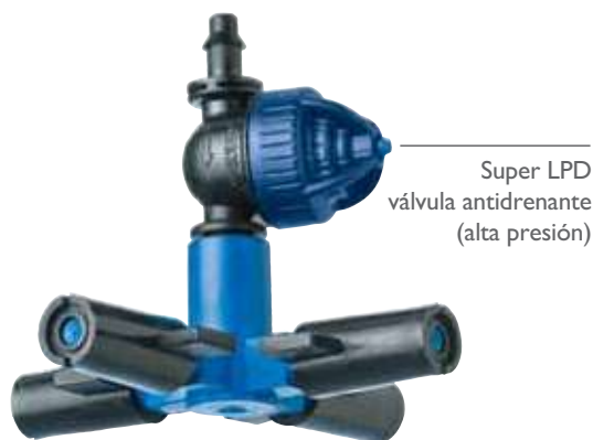
Super LPD válvula antidrenante (alta presión)