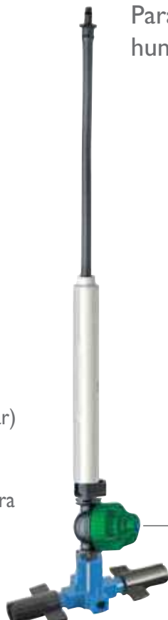
Super LPD válvula antidrenante (media presión)